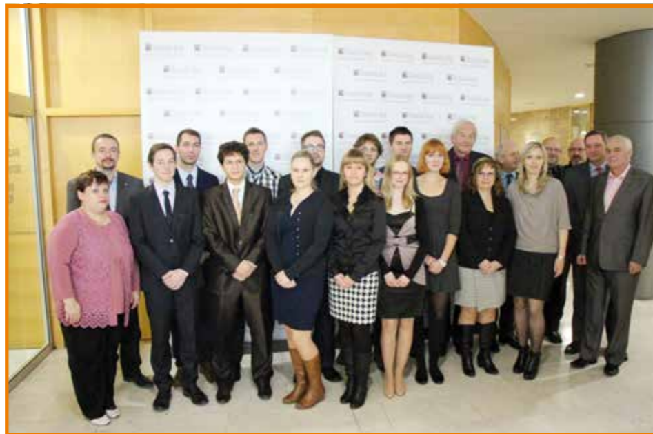
Krajská zdravotní, a. s., podepsala smlouvy se studenty zařazenými do stipendijního programu

Zásadních úprav se dočkala pravidla pro poskytování stipendií, která vzájemně stanovili oba jejich poskytovatelé Ústecký kraj a Krajská zdravotní, a. s. „V letošním akademickém roce se nebude kráťt stipendium studentům, kteří jsou současně podporováni Ústeckým krajem a Nadačním fondem Krajské zdravotní. Spojením obou stipendií je pro studenty zajištěna zajímavá finanční částka, která jim zásadně pomůže při úhradě nákladů