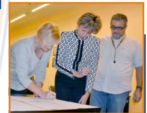
Svůj souhlas připojily všechny odborové organizace v Krajské zdravotní, a. s.