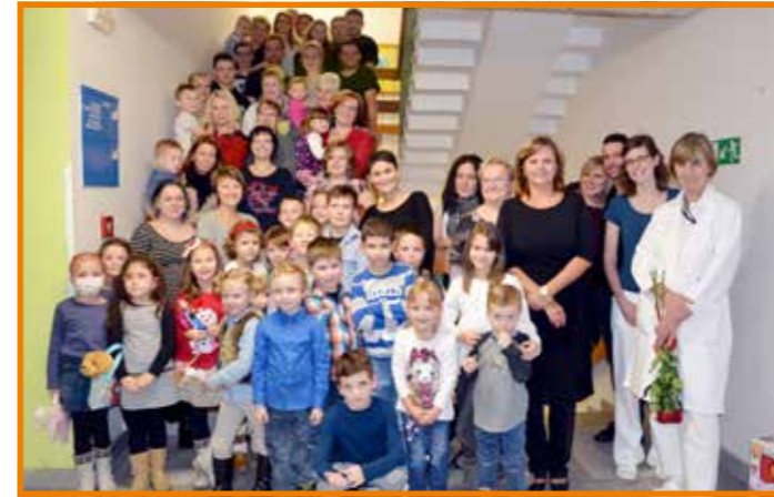
Při společném setkání nechybělo ani hromadné fotografování

Dětská klinika v Krajské zdravotní, a. s. – Masarykově nemocnici v Ústí nad Labem, o. z., uspořádala ve spolupráci s občanským sdružením „Vladka dětem“ v pátek 18. prosince 2015 druhé předvánoční setkání dětí, které jsou nebo byly postiženy závažnou nemocí – leukémií. Malí onkologičtí pacienti i jejich blízcí jsou velmi často vystavováni stresovým zážitkům spojeným s tímto onemocněním.