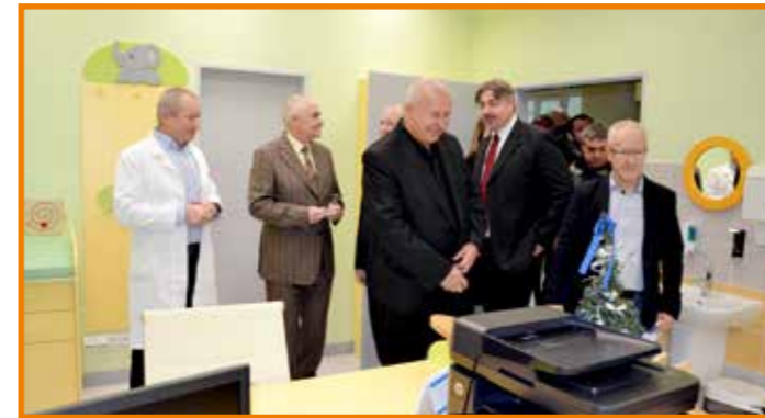
V rámci ukončení rekonstrukce části dětského pavilonu proběhla slavnostní prohlídka