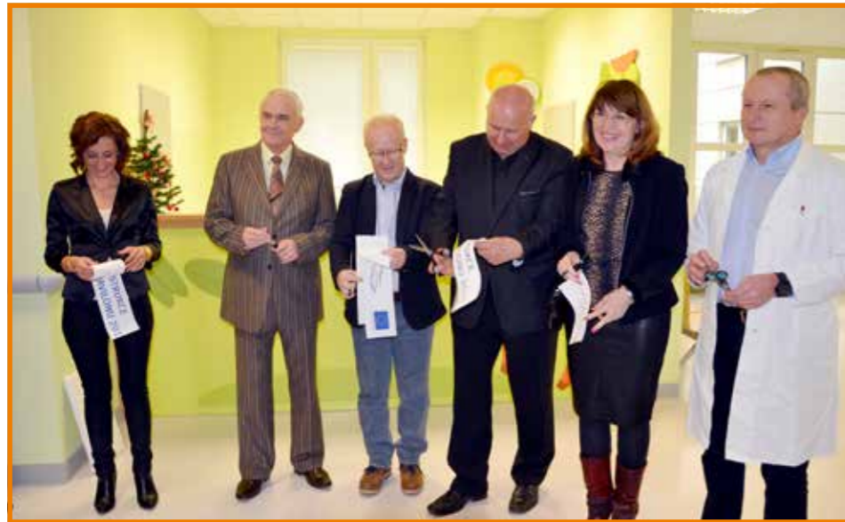
Slavnostní přestřižení pásky

Krajská zdravotní, a. s., ukončila projekt „Rekonstrukce a modernizace Dětské kliniky – KZ, a. s. – MNUL, o. z. (dětský urgentní příjem a stacionář)“, který začal v červenci letošního roku. Během stavebních prací byly vybudovány nové ambulance, stacionář a centrální šatny pro zaměstnance. Rekonstrukční práce proběhly v tomto rozsahu po více jak dvaceti letech, tedy poprvé od doby výstavby tohoto komplexu. Realizace projektu byla rozsáhlá a hodnota veřejné zakázky, vzešlá z otevřeného výběrového řízení, dosáhla 21 618 431 Kč včetně DPH s 85% finanční podporou z Evropského fondu pro regionální rozvoj prostřednictvím Regionálního operačního programu NUTS 2 Severozápad.