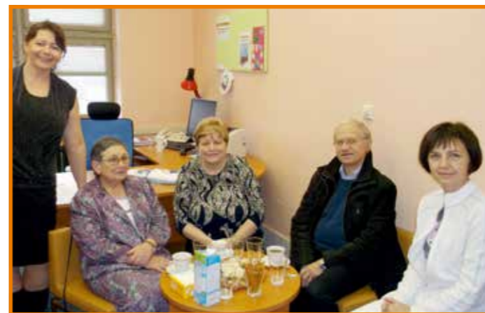
Vánoční posezení dobrovolníků s paní ředitelkou a koordinátorkou