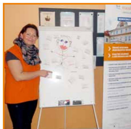
Takhle si studenti SZŠ představují dobrovolníka

Třetí činností, kterou kancelář Dobrovolnického programu KZ, a. s., chce koordinovat je zvelebování nemocničního prostředí. Po vzoru dobrovolníků z teplické nemocnice se i ti chomutovští mohou zapojit do jednoduchých zahradnických, natěračských, případně i rukodělných kreativních činností.