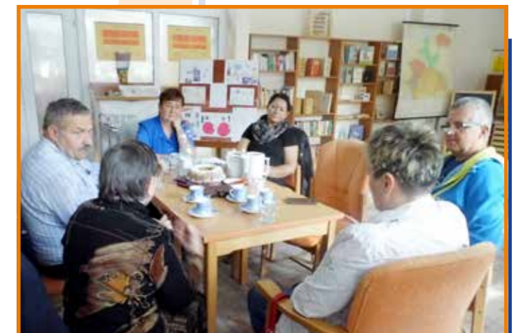
Supervize s dobrovolníky