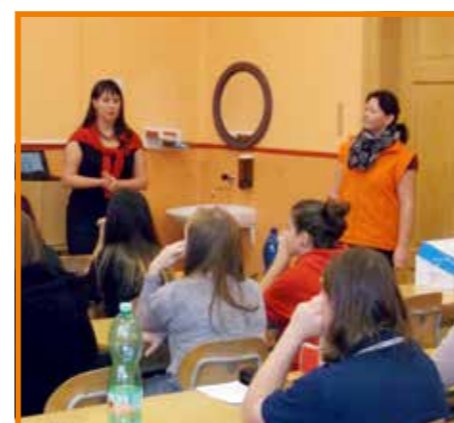
Interaktivní přednáška na téma Dobrovolnictví pro studenty 2. ročníků SZŠ