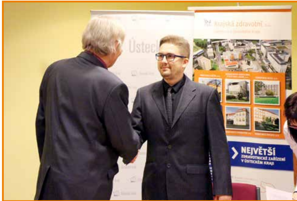
Studentům popřál hodně štěstí při zdolávání náročného studia 1. náměstek hejtmana Ústeckého kraje RSDr. Stanislav Rybák

V prostorách Krajského úřadu Ústeckého kraje došlo 4. prosince 2015 ke slavnostnímu podpisu smluv mezi Ústeckým krajem jako poskytovatelem stipendia, budoucím zaměstnavatelem Krajskou zdravotní, a. s., a vybranými mediky, kteří se zavázali pracovat v Krajské zdravotní, a. s.