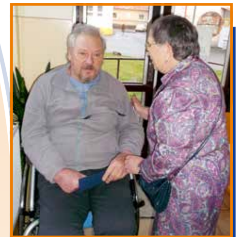
Dobrovolnická činnost u pacientů