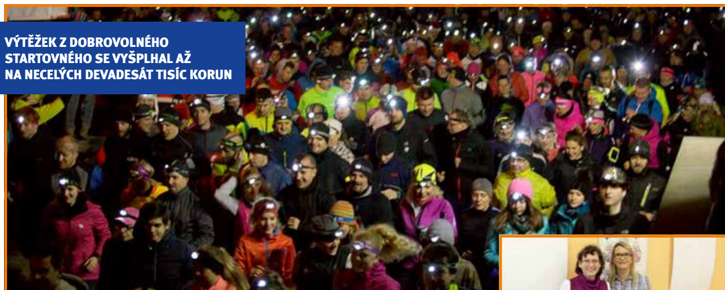
Stovky účastníků podpořily pacienty s roztroušenou sklerózou

VÝTĚŽEK Z DOBROVOLNÉHO STARTOVNÉHO SE VYŠPLHAL AŽ NA NECELÝCH DEVADESÁT TISÍC KORUN