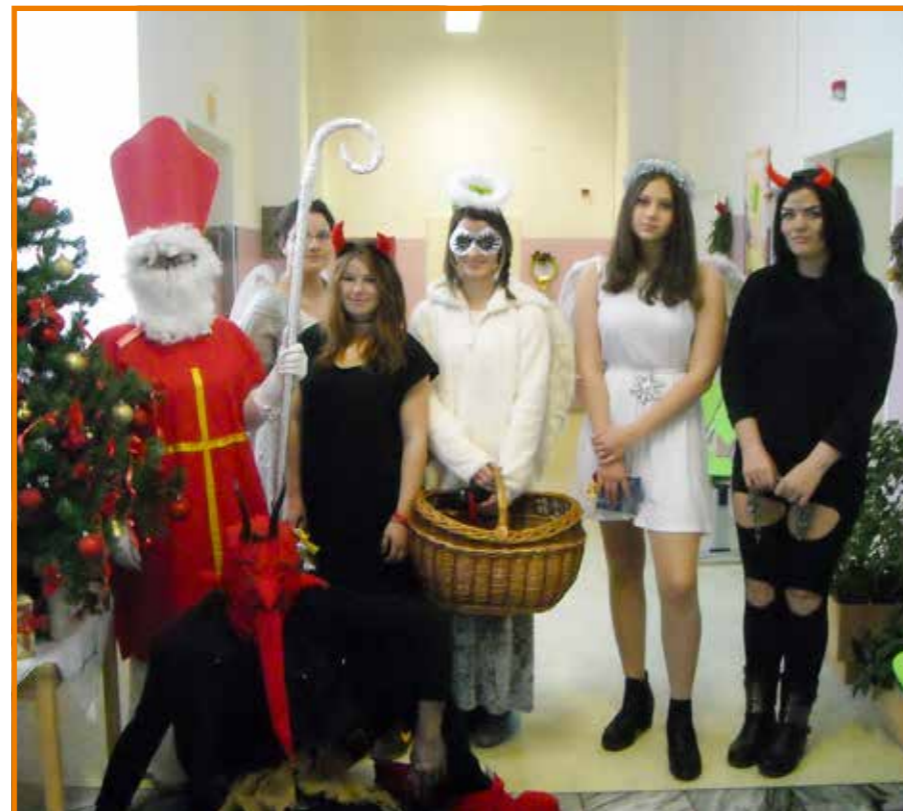
Žáci prosetické základní školy zpřijemnilí advent pacientům na oddělení následné péče

V. Loffelmanová staniční sestra ONP 2 Nemocnice Teplice, o. z.