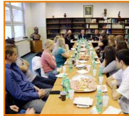
Setkání s mediky se neslo ve svátečním duchu

Zástupci vedení Krajské zdravotní, a. s., se sešli s mediky, kteří v Masarykově nemocnici v Ústí nad Labem, o. z., absolvují praktickou část výuky. Generální ředitel