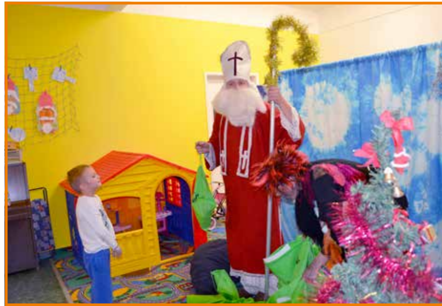
Herci z Divadla Krabice Teplice zahráli malým pacientům čerta s Mikulášem