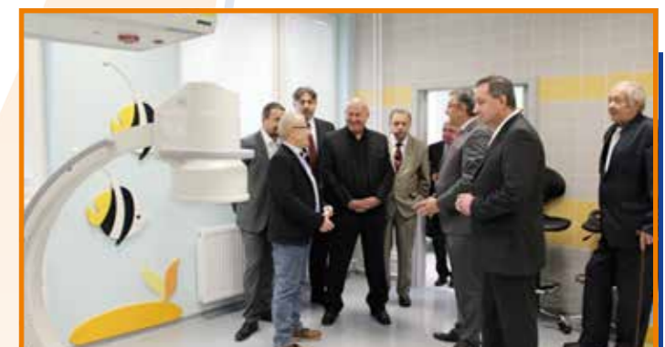
Prohlídka nových prostor