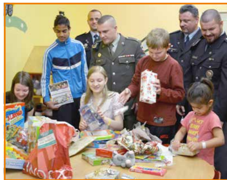
Dárky udělaly před Vánoci hospitalizovaným dětem radost

Pár dní před Štědrým večerem členové Self Defense Division, z. s., spolku zabývajícího se sebeobranou, prevencí kriminality, sportovními, kulturními a charitativními akcemi, splnili, co slíbili. V rámci sportovní výzvy „Daruj hračku!“ vybrali od účastníků nejrůznější hry a hračky a společně s příznivci z řad členů Policie České republiky Obvodního oddělení Děčín-Podmokly odvezli hračky na Dětské oddělení Masarykovy nemocnice v Ústí nad Labem, o. z., kde si hračky převzaly právě hospitalizované děti.