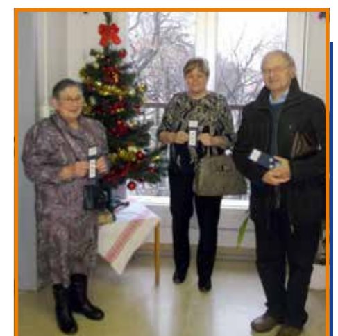
Návštěva na ONP