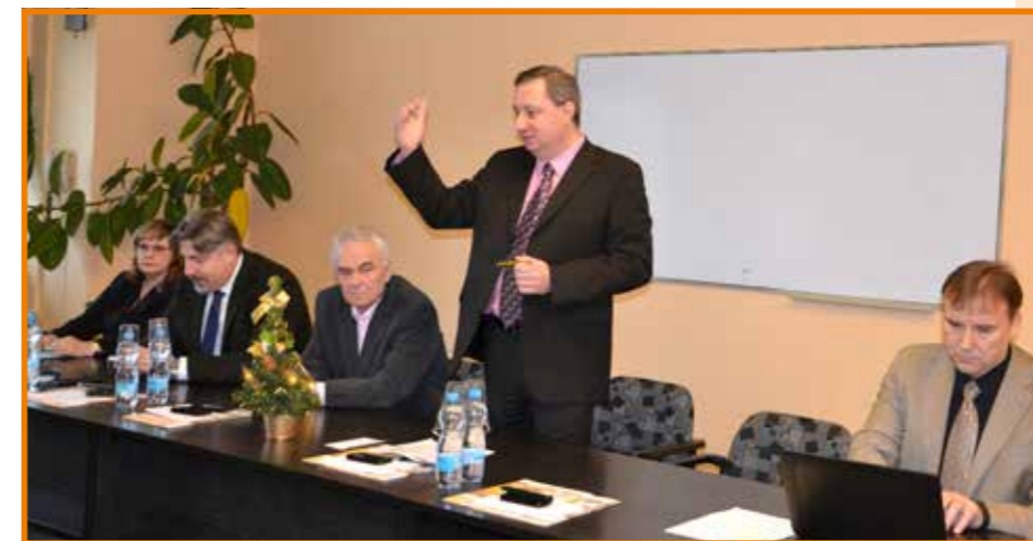
Navýšení mezd potvrdilo vedení Krajské zdravotní, a. s.

Předsedové odborových organizací působících v Krajské zdravotní, a. s., podepsali dodatek číslo 1 kolektivní smlouvy schválený představenstvem Krajské zdravotní, a. s. Nová podoba kolektivní smlouvy garantuje zaměstnancům největšího zaměstnavatele v Ústeckém kraji pětiprocentní zvýšení mzdových tarifů a společně s dalšími mzdovými opatřeními představuje plánované zvýšení osobních nákladů zaměstnanců pěti nemocnic Krajské zdravotní, a. s., v roce 2016 o 9,4 %. Předpokládané zvýšení navazuje na významný růst osobních nákladů v loňském roce, kdy bylo v prvních 11 měsících roku 2015 oproti srovnatelnému období roku 2014 vynaloženo navíc téměř o 9 % mzdových nákladů.