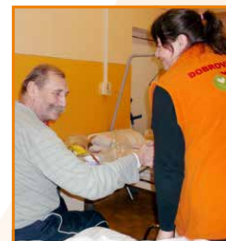
Dobrovolnická činnost u pacientů