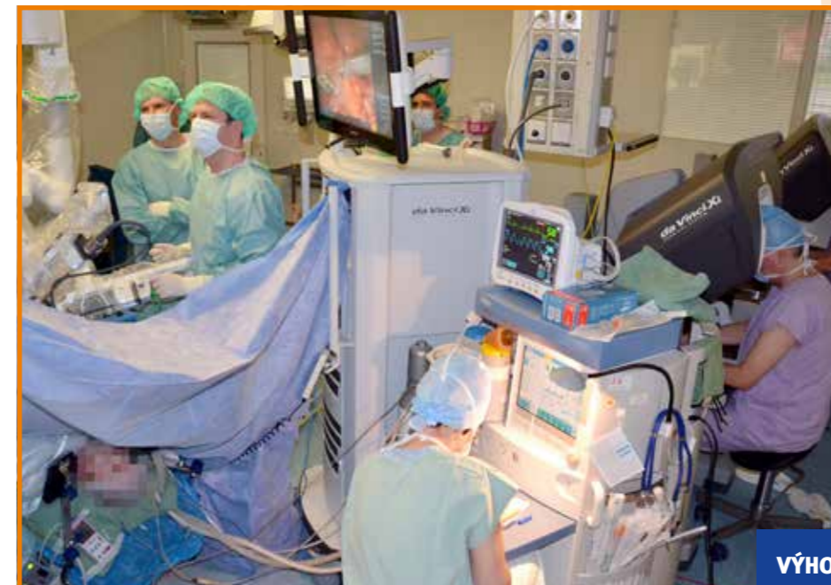
Výuka na operačním sále

Ve Školícím centru robotické chirurgie Krajské zdravotní, a. s., při Masarykově nemocnici v Ústí nad Labem, o. z., se na konci roku 2015 školily chirurgické týmy z Urologické kliniky Fakultní nemocnice v Hradci Králové a z Urologického oddělení Nemocnice Jičín. Školení proběhlo při radikální prostatektomii, což je nejčastější urologická robotická operace ve světě.