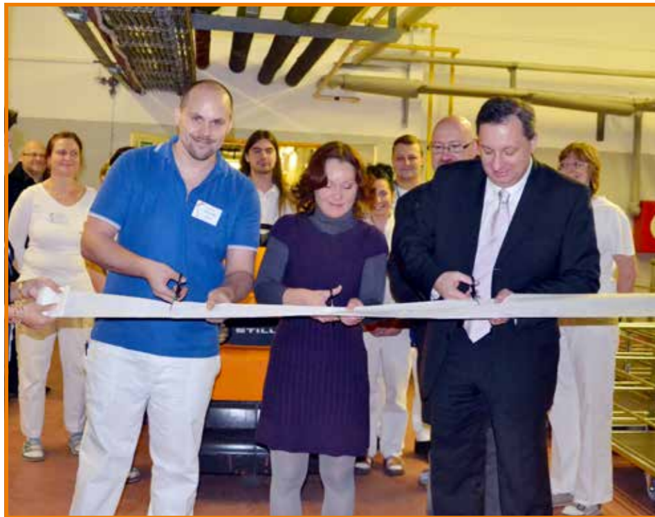
Slavnostní přestřižení pásky

Na novou logistiku distribuce léčiv a zdravotnických prostředků přešla ve svých nemocnicích Krajská zdravotní, a. s. Jednotlivá nemocniční oddělení již nejsou zásobována zdravotnickým materiálem, infuzními roztoky a dezinfekcemi přes externího dopravce, ale přes lékárnu dané nemocnice.