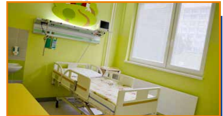
Zrekonstruované prostory září doslova novotou