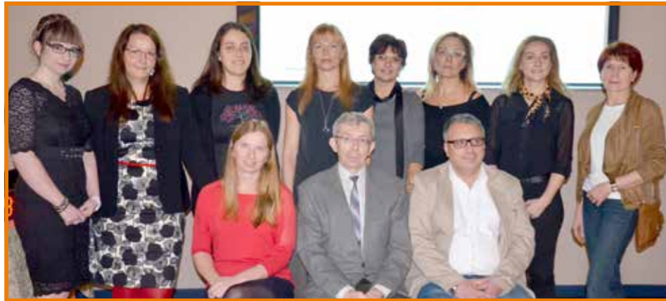
Kolektiv lékařů Očního oddělení Nemocnice Most, o. z.

V době rekonstrukce mostecké nemocnice jsme poprvé nevyužili přednáškové prostory kinosálu přímo v areálu nemocnice, ale naše tradiční odborné předvánoční setkání se konalo 4. 12. 2015 v reprezentativních prostorách hotelu Cascade. Na programu bylo 19 sdělení týkajících se dětské oftalmologie, zevního oka, katarakty, glaukomu i sítnice a v závěru bylo referováno o nových léčivech.