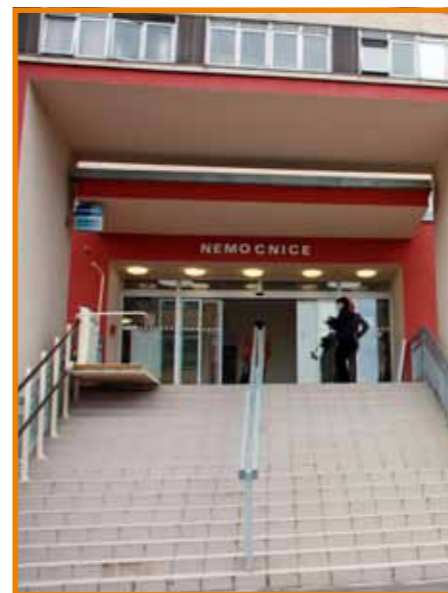
Vchod do mostecké nemocnice

Tradiční akcí se již stalo 4. Mostecké oftalmologické setkání, na kterém se v pátek 7. prosince 2012, v kinosále mostecké nemocnice, sešlo přes 40 očních lékařů a 30 zdravotních očních