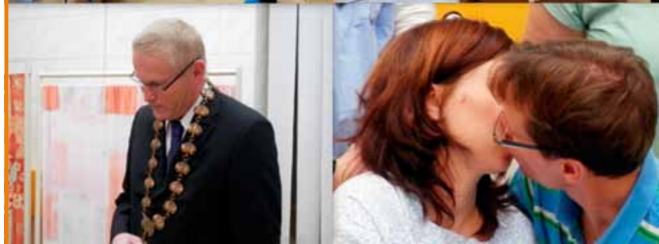
Svatba trochu jinak...