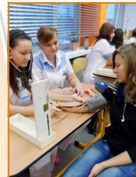
Praxe v měření tlaku

Akce nebyla přínosem pouze pro návštěvníky zdravotnické školy. Pro budoucí zdravotníky – žáky a studenty byla také formou projektové výuky, jejímž cílem byl především rozvoj komunikativních dovedností, šíření praktických znalostí, dovedností, odborných rad a návodů. Všem účastníkům akce byly poskytnuty základní informace jak nakládat se svým životem, aby se nám žilo příjemně a co nejzdravěji! A kdo by nechtěl být zdravý?