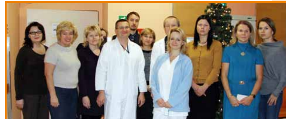
Delegace z Ruska

Výše uvedená delegace přijela za účelem načerpání bohatých zkušeností lékařů pracujících v KZ, a. s. Celá skupina se zajímala zejména o strukturu fungování jednotlivých oddělení, systém komunikace s pacienty, edukační možnosti KZ, a. s., systém fungování rychlé pomoci apod. Zkušenosti, které zde načerpali, by chtěli aplikovat při své praxi v Rusku.