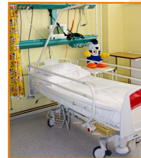
Lůžka intenzivní péče