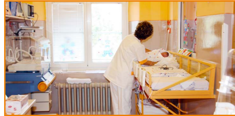
Péče o novorozence