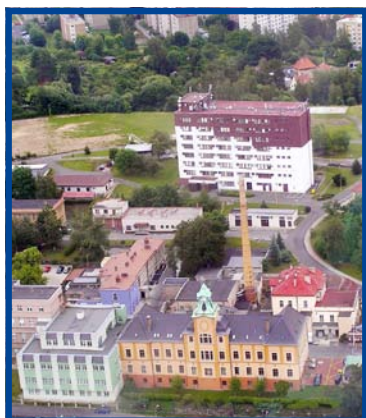
Areál děčínské nemocnice