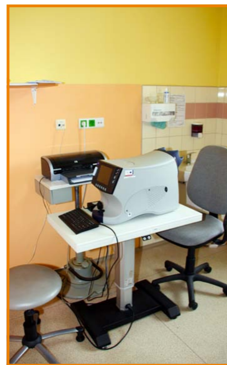
Přístrojové vybavení očního oddělení

Oční oddělení v Děčíně provádí také řadu plastických operací . Z nich nejčastěji kosmetickou úpravu víček s odstraněním kožního nadbytku. Dále provádíme odstraňování zánětlivých afekcí víček, malých lézí (bradavičky, kožní nádorky apod.).