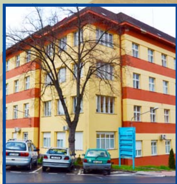
Budova interního pavilonu