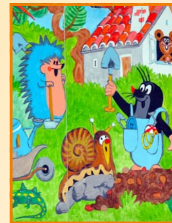
Výzdoba dětského oddělení