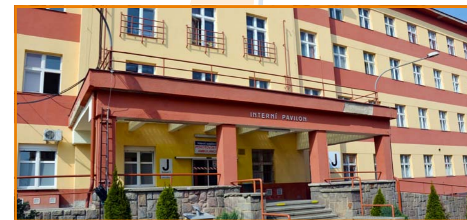
Budova interny v areálu Nemocnice Teplice, o. z.

Rozhodně však není pravdou, že bychom se neměli čím pochlubit v oblasti péče, kterou poskytujeme našim klientům a pacientům. Jako příklad zmiňme, že radiodiagnostické oddělení a oddělení centrální sterilizace, onkologické oddělení a lékárna mají certifikaci podle ISO 9001, biochemická laboratoř pak ISO 15189, stravovací úsek je certifikován dle HACCP, neurologické oddělení má akreditaci II. stupně, což z něj činí pracoviště nejvyššího typu v rámci KZ, mnoho našich oddělení má akreditace I. stupně