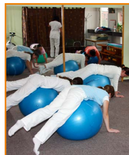
Cvičení na balonech

Nachází se v areálu nemocnice v budově D. Lůžkové oddělení je ve 2. patře, ambulantní provoz v přízemí. Je to výhodné hlavně z důvodu, že jeho vybavení lze snadno využívat i při léčbě hospitalizovaných pacientů.