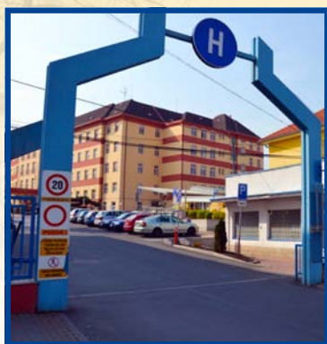
Vjezd do areálu nemocnice