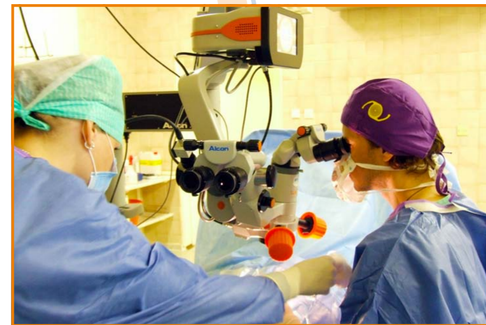
Na operačním sále

torické (při nepravidelném zakřivení rohovky), případně jejich kombinaci – čočky multifokální torické. S využitím speciální 3D analýzy přední části oka na přístroji Pentacam a nového přístroje IOL Master s upgradem na nejmodernější výpočetní formule čoček, spolu s vytvářením tzv. optického řezu sítnice na spektrálním OCT přístroji, jsme schopni vyloučit nevhodné kandidáty na implantaci těchto prémiových čoček a zároveň snížit procento nežádoucích pooperačních chyb na minimum.