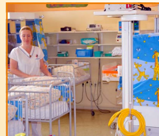
Oddělení patologických novorozenců