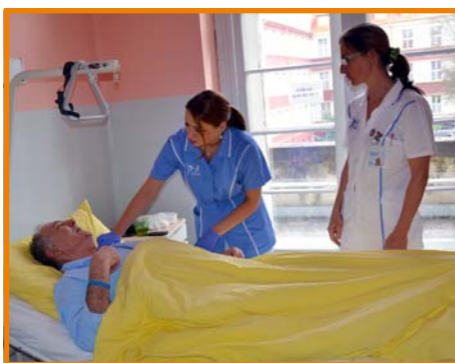
Péče o pacienta

Pokud lékař indikuje pacienta k hospitalizaci, ocitne se na jedné ze stanic, podle konkrétního problému, který ho trápí. Naše oddělení má celkem 4 standardní stanice rozdělené podle svého zaměření na cévní, traumatologickou, břišní a septickou. Stejně jako většina oddělení v nemocnici nabízí i chirurgie jeden dvojlůžkový a několik jednolůžkových