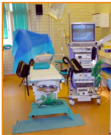
Operační sál urologie

vybavení a zkušený personál zaručuje pacientům po náročných operacích poskytnutí odpovídající pooperační péče. Po nejnáročnějších výkonech je pacient ihned po operaci převezen na oddělení ARO ke stabilizaci zdravotního stavu a poté se vrací zpět na naše oddělení.