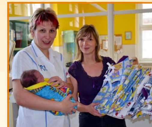
Převzetí veselých zavinovaček od Občanského sdružení Nová Ves