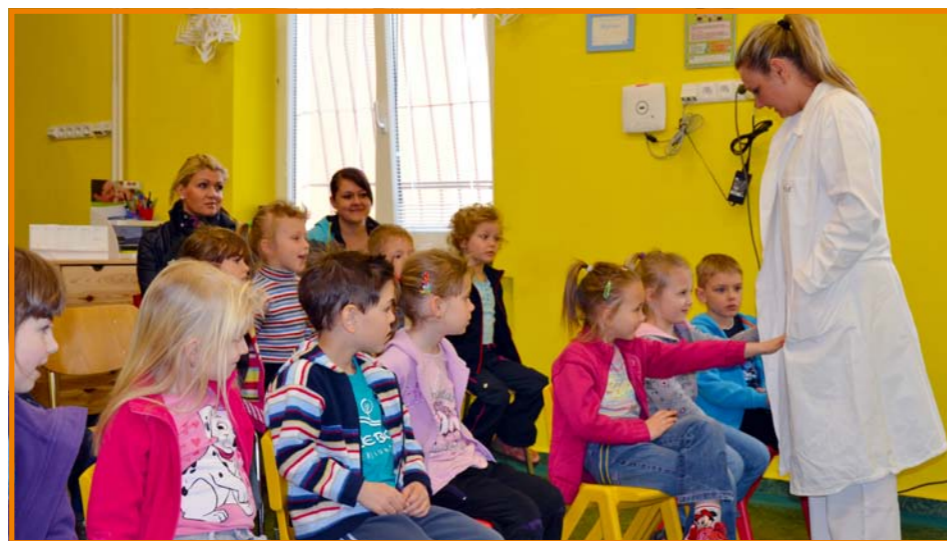
Seznamujeme školky s nemocnicí

V případech, že rodiče dítěte nemohou z nějakých osobních důvodů trávit celý čas hospitalizace s dítětem, existuje možnost neomezených návštěv – samozřejmě v době, kdy nedochází k narušení chodu oddělení.